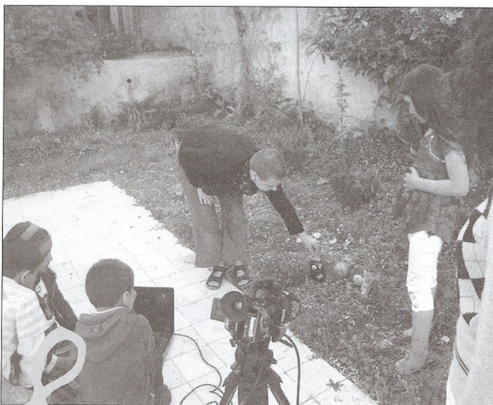
Det kræver sit barn at lave en film

Efter to intense uger var det tid til at besøge Petra, der står midt i ørkenen