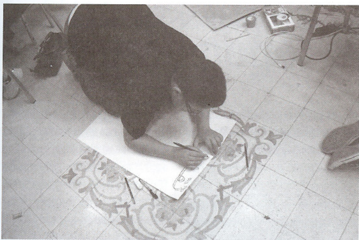
Man skal holde tungen lige i munden for at få det helt rigtigt

skabt i de rosabeige klippeformationer. Man kommer ind til dem igenem en siq, en smal passage, og lige pludselig er de store smukke facader skabt af nabatanerne der. Der er hugget rum ind i klipperne og facadene til templer, gravkamre, paladser og offentlige bygninger er udsmykket med søjler, portaler, skulpturer og udsmykninger i stuk og udhuggede mønstre. De er fra cirka 200 f. K.-300 e.K.