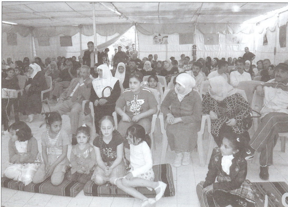
Så er der premiere!